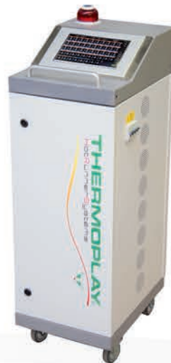
24÷48 зон модулями по 6 зон 24÷48 zones, modules of 6 zones 24÷48 зони модули от по 6 зони (24, 30, 36, 42, 48)