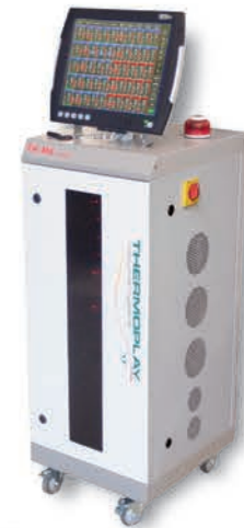
24÷240 зон модулями по 6 зон 24÷240 zones, modules of 6 zones 24÷240 зони модули от по 6 зони (..., 48, 54, ..., 240)